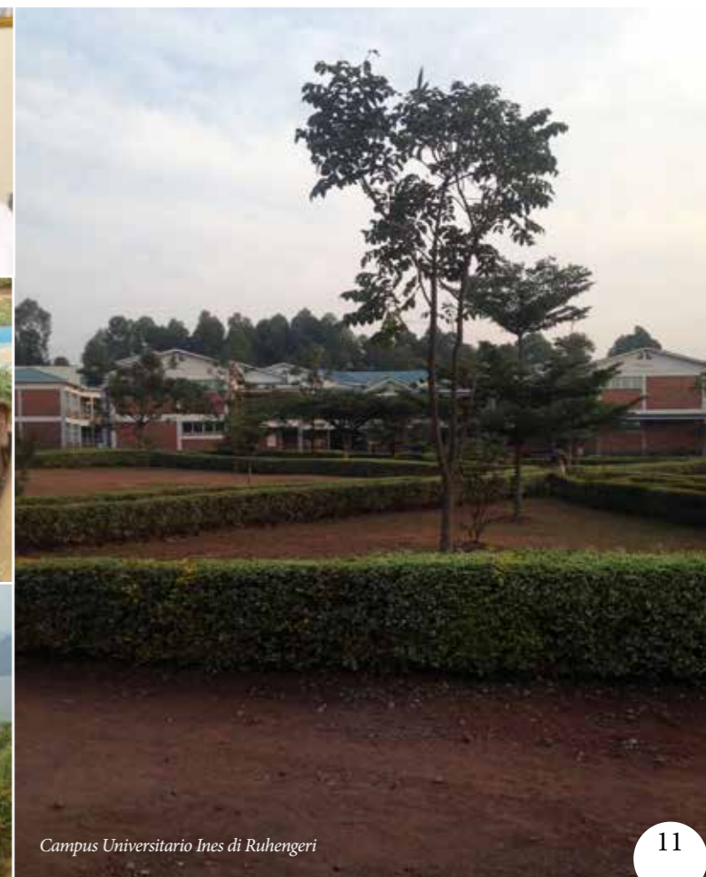
Campus Universitario Ines di Ruhengeri