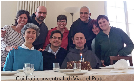
Coi frati conventuali di Via del Prato