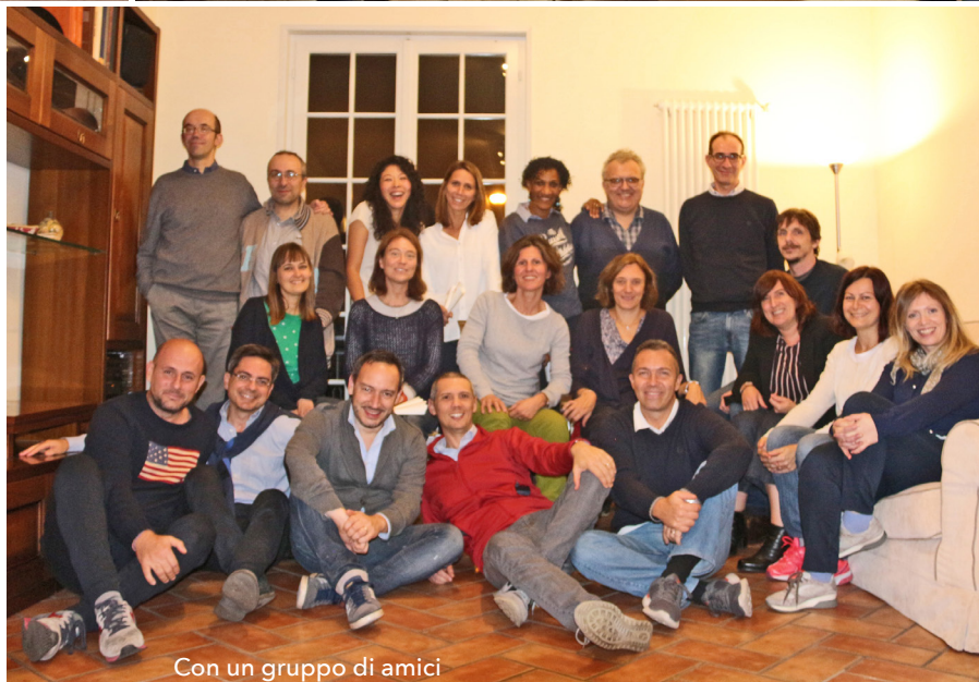
Con un gruppo di amici