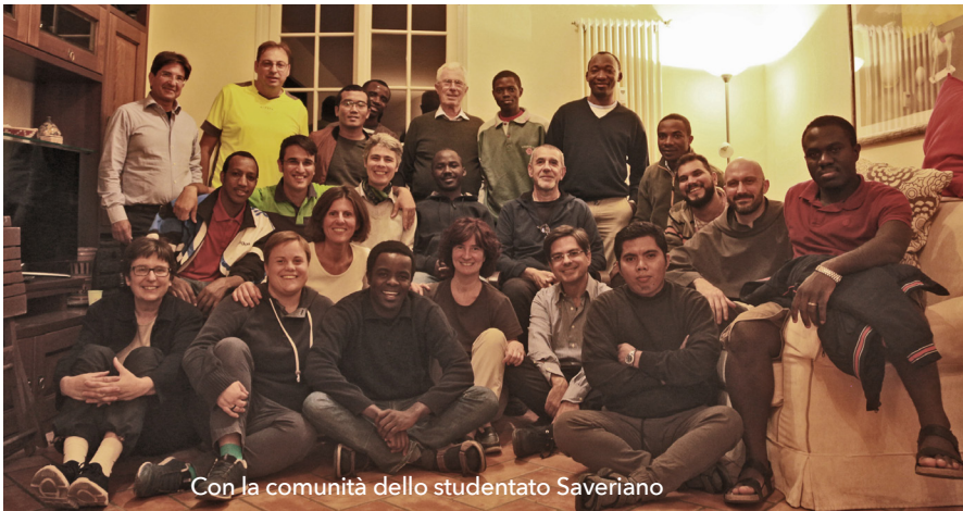
Con la comunità dello studentato Saveriano