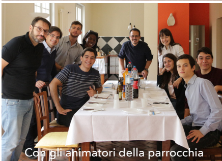
Con gli ahimatori della parrocchia