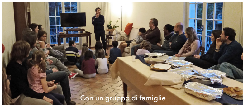
Con un gruppo di famiglie